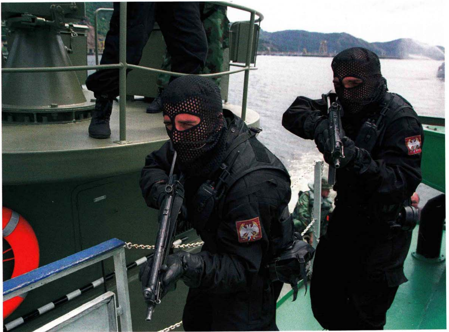
Партнерство: противтерористичке јединице Војске Србије и Црне Горе и Републике Румуније на вежби "Плави пут"

ма у оквиру Партнерства за мир". Током 2005. године ова могућност је постепено све чешће коришћена. Све је више семинара, програма обуке и вежби земаља чланица НАТОа и Партнерства за мир на које су позвани и наши официри и други експерти. Тренутно се унутар Алијансе припрема наредни петогодишњи план војних вежби у оквиру Партнерства за мир, а представници наше војске су позвани да у његовој реализацији учествују од самог почетка. То је добра прилика да се изблиза сагледају оперативне активности НАТОа и да се увежбава интероперабилност са јединицама под његовом командом.