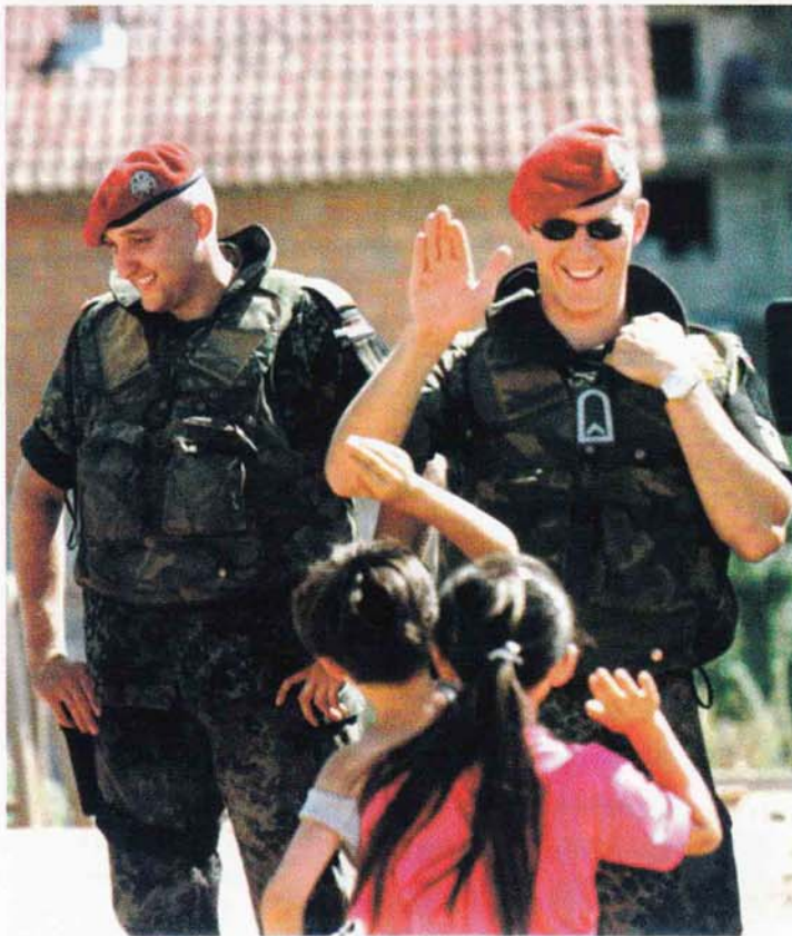
Очување мира: припадници немачког контингента у саставу НАТОа на Косову

Политичко-војним консултативним комитетом, као радним телом програма Партнерство за мир, председава заменик генералног секретара Северноатлантског савеза, без обзира на