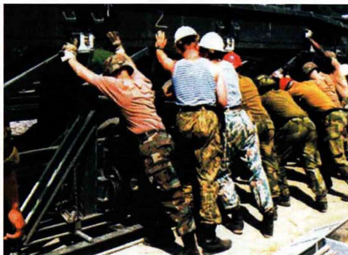
Снага и без оружја: подизање моста у Босни

У конкретне циљеве Партнерства за мир сврставају се: - обезбеђење јавности рада националне одбране у процесу доношења буџета; - обезбеђење демократске контроле одбрамбених снага; - одржавање способности и спремности да се, у складу с уставним претпоставкама, учествује у операцијама по овлашћењу УН и/или према овлашћењима Оебса; - унапређење војних односа сарадње с НАТОом ради заједничког планирања, обуке и вежби ради јачања способности учесника Програма Партнерство за мир, како би остварили своју мисију на плану одржавања мира, хуманитарних операција и осталих активности; - дугорочни развој таквих снага које ће бити у стању да боље дејствују заједно с чланицама Северноатлантског савеза.