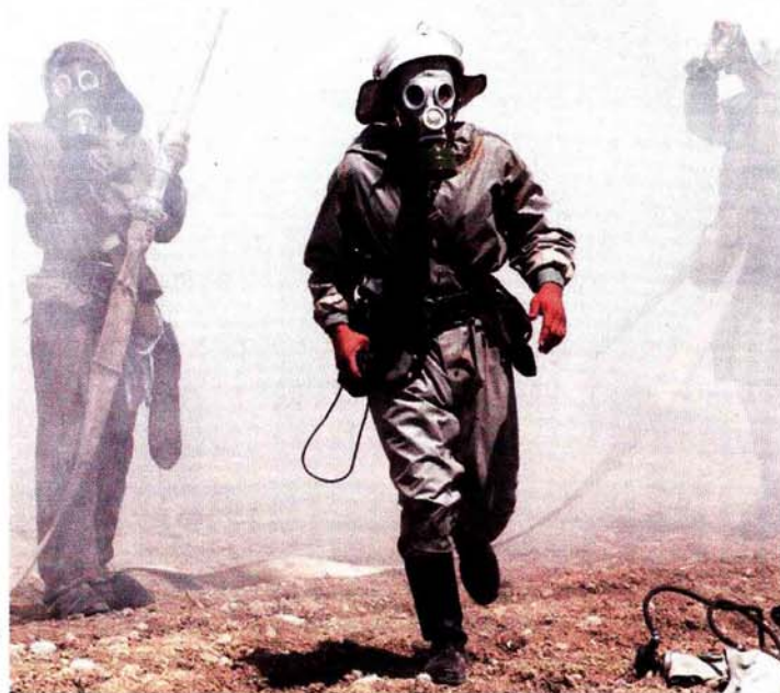
Одговор на нападе хемијским оружјем

Од свог оснивања, Програм има за циљ постизање одговарајућих способности и спремности за очување мира преко заједничког планирања, обуке и војних вежби, а тиме и повећања оперативности између војних снага партнера и НАТОа. На тај начин се, такође, олакшава сагледавање процеса планирања и доношења буџета за националну одбрану, а и омогућује лакше остваривање демократске контроле оружаних снага. Облик остваривања сарадње према Партнерству за мир подразумева и канцеларијски простор у седишту НАТОа (официре за везу земаља партнера), затим