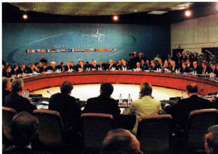
Најважније тело за доношење одлука: заседање Северноатлантског већа

За време хладног рата, улога НАТО и његов смисао могли су лако да се одреде. У том периоду, Савез је успео да обезбеди колективну одбрану од било ког облика агресије и сигурно окружење за економски развој земаља чланица.