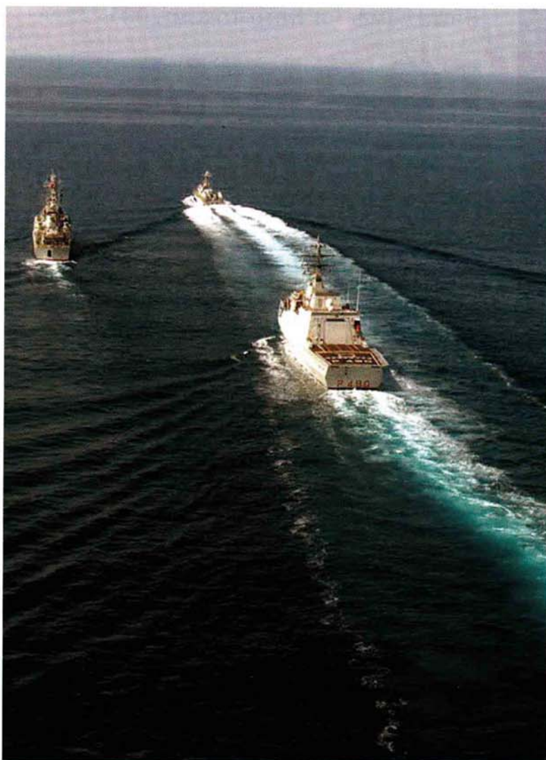
Заслужене високе оцене: поморска вежба наше и Ратне морнарице Републике Италије "Заједнички хоризонт 02 - 2005."